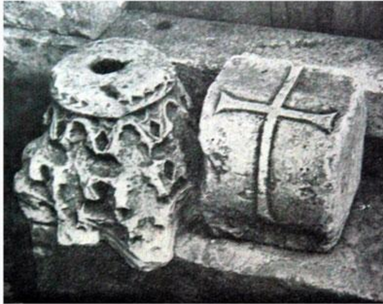
Дерокова мапа на којој су приказани село Београд на периферији Истанбула и Београдско насеље недалеко од Златне капије / Фрагменти украса цркве

Београд је 1427. после смрти Високог Стефана уступљен Угарској. Угарски војници и већинско српско становништво одбијају неколико османских опсада, све до Сулејмановог похода.