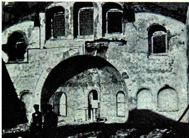
Олтарски простор у Истанбулу после пожара 1955.