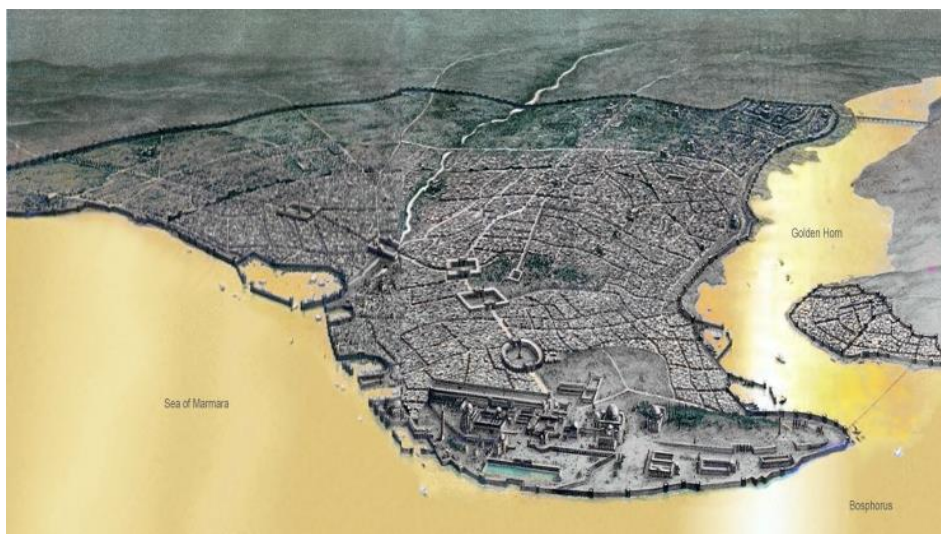
Панорама града, како би изгледао непосредно пре напада.

Чак и када је латински језик замењен грчким, Византинци су и даље себе сматрали Римљанима. У раном средњем веку они су повратили контролу над многим раније изгубљеним територијама, пре свега на Италијанском полуострву. Борили су се с разним силама у настајању и суочили с неколико покушаја заузимања њиховог главног града, опасаног троструким бедемима. Једини пут када је освојен то је било уз помоћ унутрашњих сукоба и издајства који су се поклопили с Четвртим крсташким ратом. Страни завојевач никада није успео да продре кроз зидове великог града.