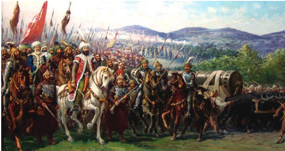
Мехмед II Освајач пред освајање Константинопоља

Римско царство није пропало 476. године уклањањем императора Ромула, нити падом Рима. Оно је наставило да живи снажним замахом на истоку, кроз моћно Византијско царство. Иако га ми знамо као Византијско царство, за његове становнике је оно било несумњиво Римско.