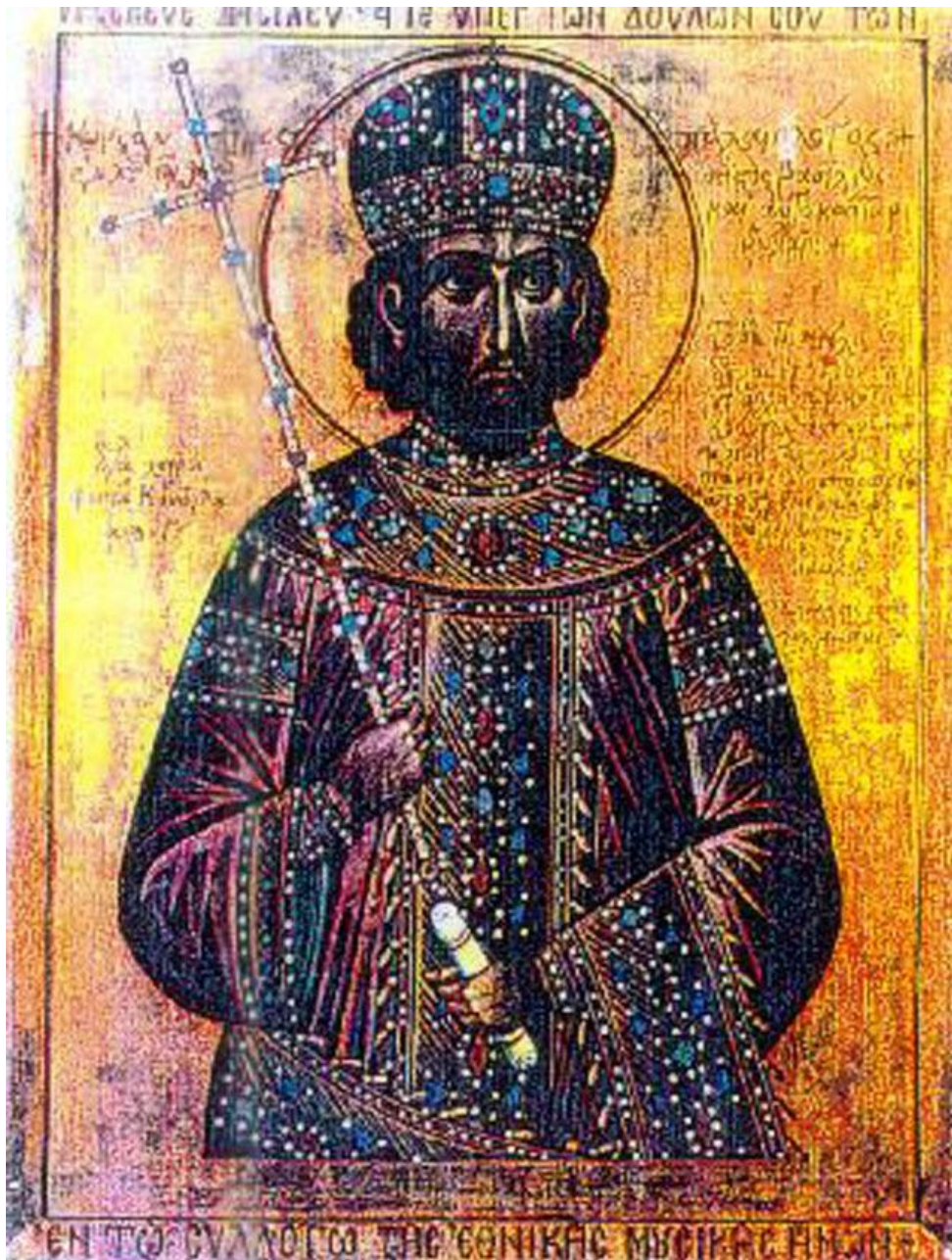
Константин XI Палеолог, последњи император Византијског царства

Ова примитивна пушка је уништила и тај и сваки нови талас турског напада и приморала Мехмеда да осмисли нову тактику. Иако је у бедемима већ било отворено неколико рупа, оне су се показале неефикасним јер су рупе биле брзо затворене бачвама пуним земље, које су, штавише, амортизовале артиљеријску паљбу боље него зидови. Чак и када би непријатељ напао пре него што би браниоци успели да поправе оштећење, јаз између унутрашњег и спољног зида доводио је сваког нападача у ситуацију да буде нападан бочно са три стране, док је с главног зида био изложен пушчаној паљби.