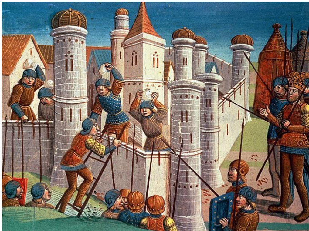
Опсада града, средњовековна минијатура.

Отоманска флота је 9. априла неуспешно покушала да пробије ланац на улазу у Златни рог. Византинци су, захваљујући томе, успели да униште велики део турске флоте гађајући је топовима са бродова у заливу и са морских бедема дуж Рога. Међутим, Турци су узвратили византијској флоти тако што је Мехмед наредио да се неколико бродова пребаци копном од Босфора до Златног рога и тако заобиђе ланац.