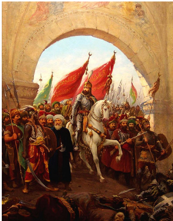
Улазак Султана – победника у нову престоницу

Пошто је установио Константинопољ/Истамбул као главни град, Отоманско царство је цветало наредних неколико стотина година.