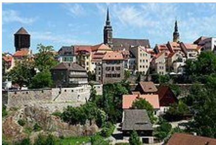
На слици Будишин- "престоница" лужичких Срба