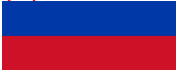
застава Лужичких Срба

Нешто касније, кад су Лужички Срби организовали конференцију за новинаре на којој су указали на алармантно стање те мањине у Немачкој, уследила су многа питања на која су они Немцима одговорили да Србију сматрају својом прадомовином, а да понекад сународ са Балкана гледају као њихово “одлутало” потомство.