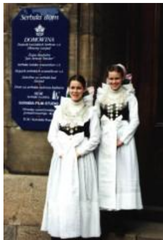
Српкиње из Лужица

Оспоравање и забрањивање језика Лужичких Срба имало је сличну судбину оспоравања и негирања језика и писма балканских Срба, пишу историчари. “Године 1334, Лајпцишки парламент је донео пропис да се свако онај ко проговори лужичкосрпским језиком кажњава смртном казном. То је било време када су лужичкосрпски писци из протеста писали на латинском, а не и на немачком језику. Доласком Хитлера на власт донети су следећи прописи: