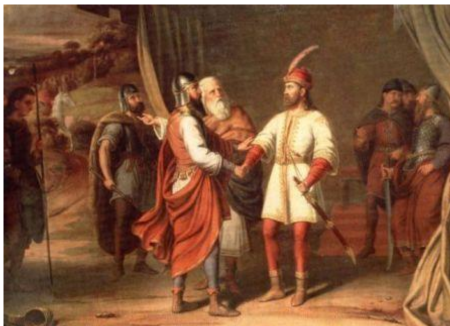
Савез Људевита Посавског са Словенцима (J. F. Муске)

Срби се помињу у време кад, у тим документима, нема помена о Хрватима, нити о хрватским државама. Помињу се у деветом столећу само Срби и словенска племена, а од кнежевина: Славонска и Далматинска. Ни у владарским титулама нема помена о Хрватској.