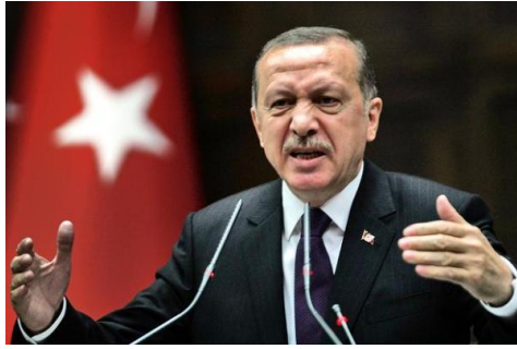
Турски лидер, Реџеп Тајип Ердоган

Међутим, након евентуалног уласка у састав Великог Турана, на чему се сада интезивно ради, и турчења већег дијела становништва, на тој територији појавиле би се енклаве криптошиита, криптохришћана, криптојевреја, као и криптоазербејџанаца, који би официјално практиковали сунитски ислам, а тајно се придржавали своје вјере.