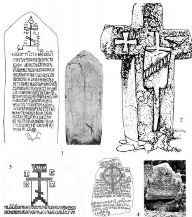
Сл. 91. Крстоображни споменици: 1. споменик постављен на месту смрти деспота Стефана, Маркован; 2. крстича са приказаним штитом и мачем, Бихово у Поповом пољу; 3. Смедерево, штит деспота Турђа Бранковића, „господина Србљем и Поморују Зетском“ из 1430, изведен описом на градској кули; 4. споменик са повесљом о даривању цркве из 1592. г., Горња Битова, Сиритишка жупа.

Споменик у виду усправљене плоче са великим урезаним крстом изнад опширног записа, постављен је на месту смрти деспота Стефана, данас Црквина у Марковцу код Младеновца.