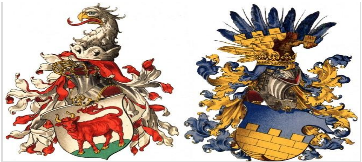
Историјски грбови Доње и Горње Српске Лужице

Дошла она кући, а гле – листови који су се на прегачи задржали, претворили се у чисто злато. Потрчи девојка натраг на оно место где је лишће просула, али тамо не нађе ништа.”