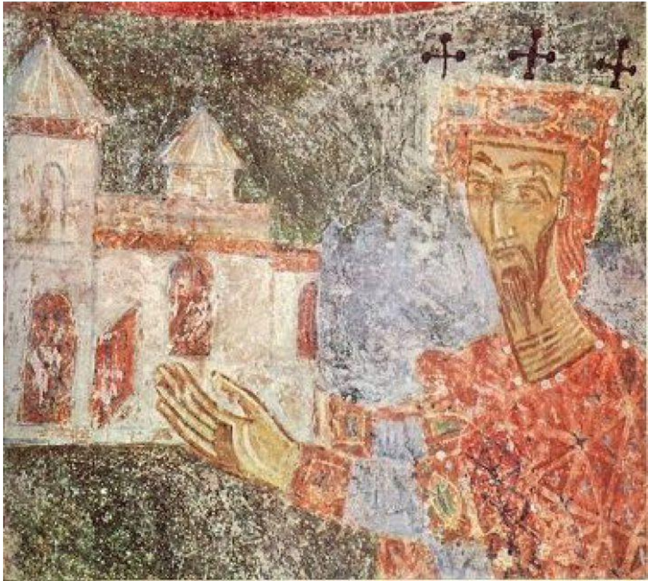
Зетски краљ Михајло, отац Константина Бодина – ктиторски портрет из цркве Св.Михајла у Стону, XI век