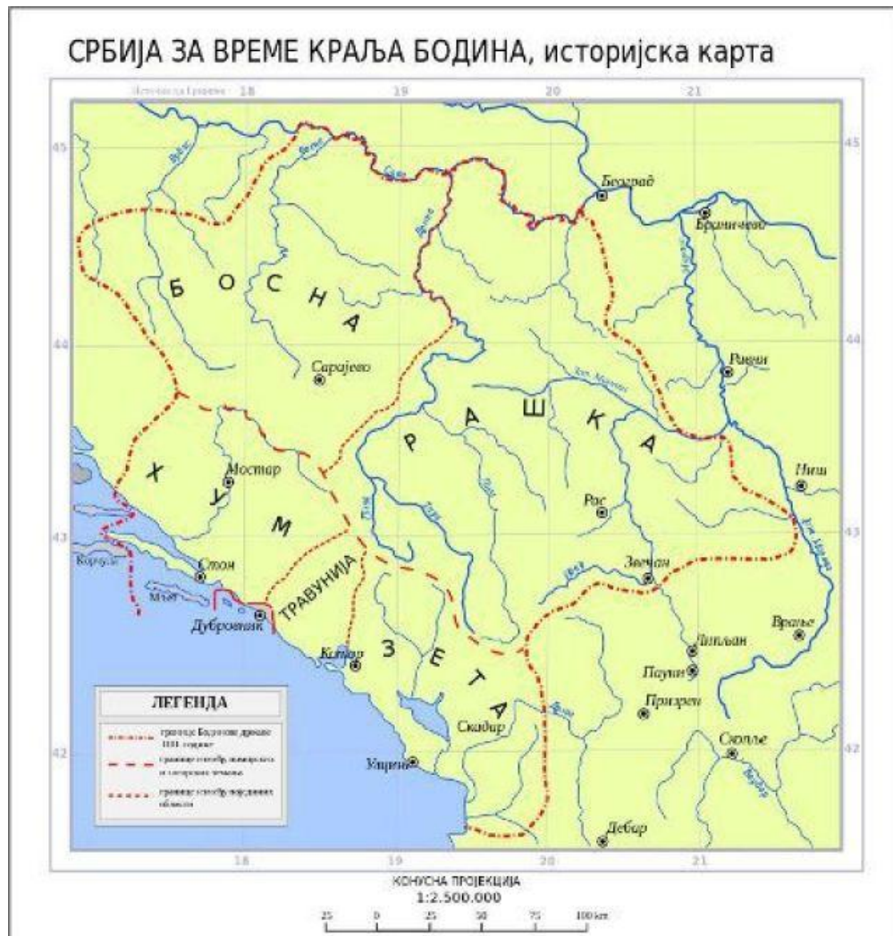
Подела Бодинове државе

Примери као што је Константин Бодин дају одговор и показују континуирани правац напредовања српских владара.