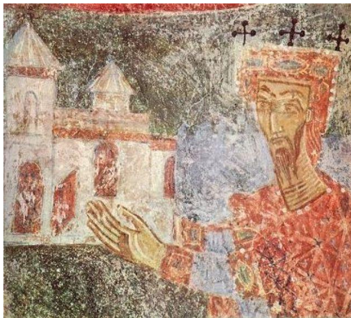
Зетски краљ Михајло, отац Константина Бодина – ктиторски портрет из цркве Св. Михајла у Стону, 11. век

Међутим, новооткривени печат из истамбулског археолошког музеја сведочи да је Константин Бодин, српски владар из друге половине 11. века, носио краљевску титулу. Бодин је био син првог српског краља – Михајла, па се намеће мишљење да је титулу задобио правом наследства. Међутим, овакве привилегије је могао да одреди само византијски цар и оне нису део наследне традиције. Како је онда овај српски владар постао краљ?