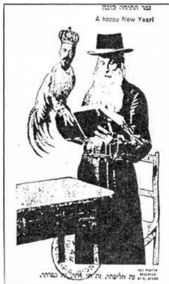
Жидовска честитка из 1907. године приказује рабина који држи жртвеног петла са главом св. Цара Николаја 2.

Ту су тела Царских Мученика истоварена, раскомадана, поливена бензином и бачена на две велике ватре. Кости су уништаване помоћу сумпорне киселине. Три дана и две ноћи убице су, уз помоћ 15 одговорних партијских комуниста специјално мобилисаних у ту сврху, радиле под непосредним руководством Јуровског , по упутствима Војкова и под надзором Голошчокина и Белобородова , који су неколико пута долазили из Јекатеринбурга у шуму.