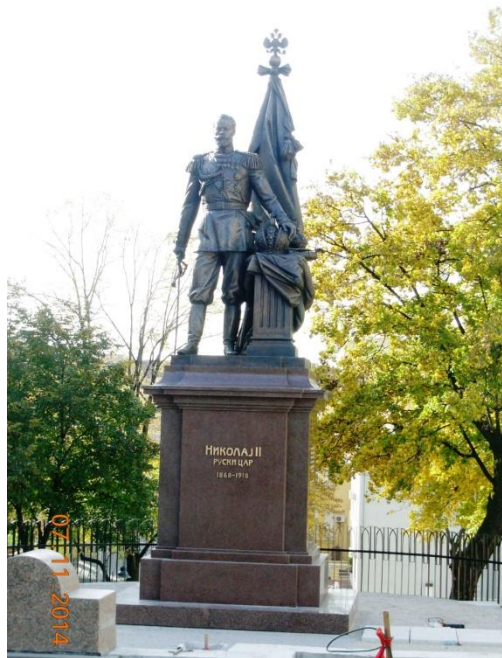
Споменик Цару Николају Другом Романову, Српском добротвору и спасиоцу, у Београду.

Онај који је срушио кућу у којој је убијен последњи руски Цар, зато што је постала поклоничко место где су се сабирали православни са свих страна Русије, звао се Борис Јељцин. Рушење је обавио као шеф уралског обласног комитета КП СССР 1977.