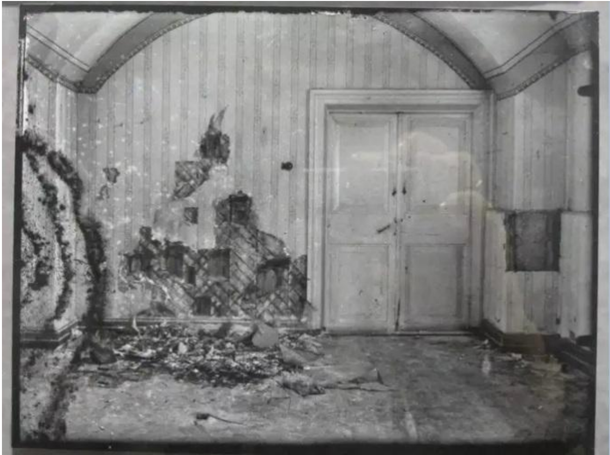
Соба у којој је стрељана св. Царска породица

Кроз прозор се зачула бука мотора камиона од четири тоне «Фиат», спремног за превоз тела. Стрељање уз буку камионског мотора, да би се пригушили пуцњи, представљало је омиљени поступак чекиста. То је учињено и овога пута.