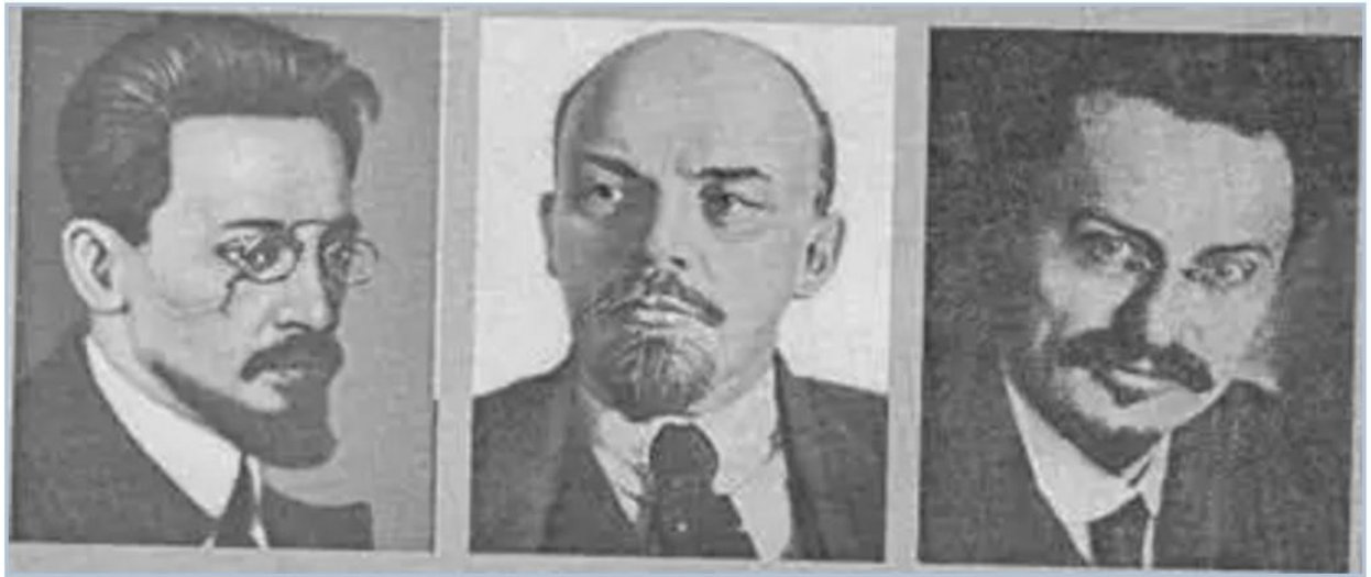
Свердлов (Розенфељд), Ленин (Бланк), Троцки (Бронштајн)