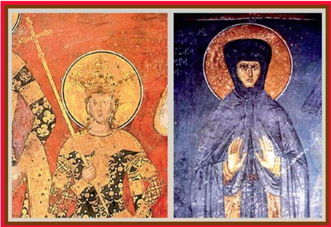
Краљ и краљица: Урош I и Јелена Анжујска