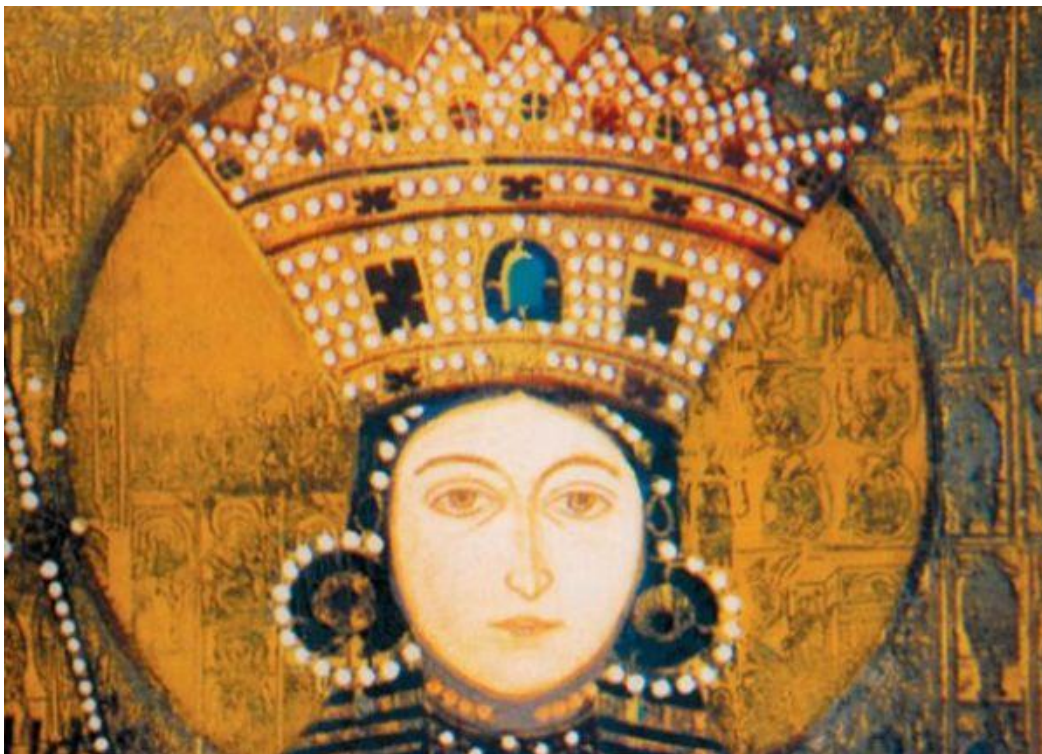
Краљица Јелена Анжујска као монахиња Јелисавета

Династије које су владале Европом – Господари од Куртенеа