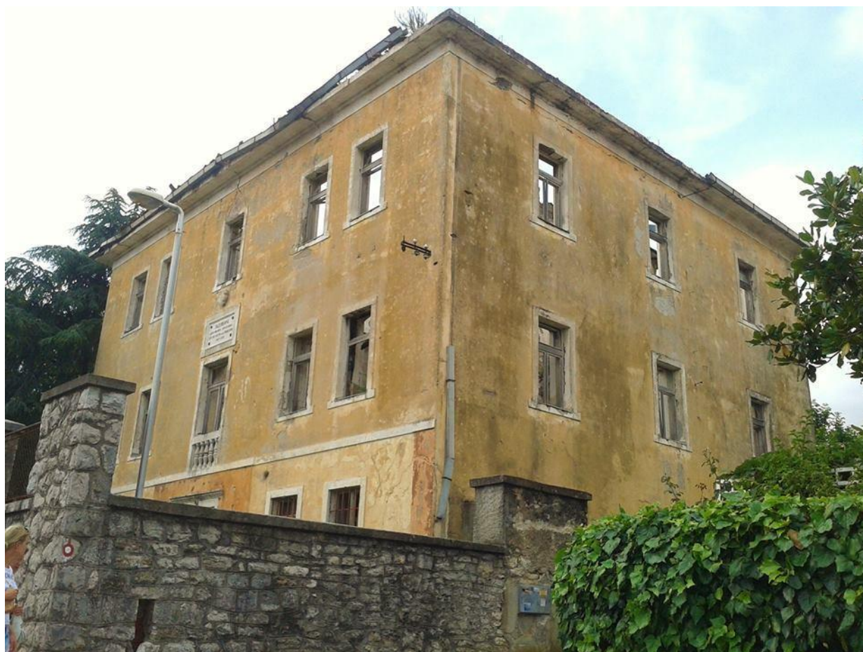
Зграда Српске поморске закладне школе

Предпоставља се да је већ тада имала свој статут.