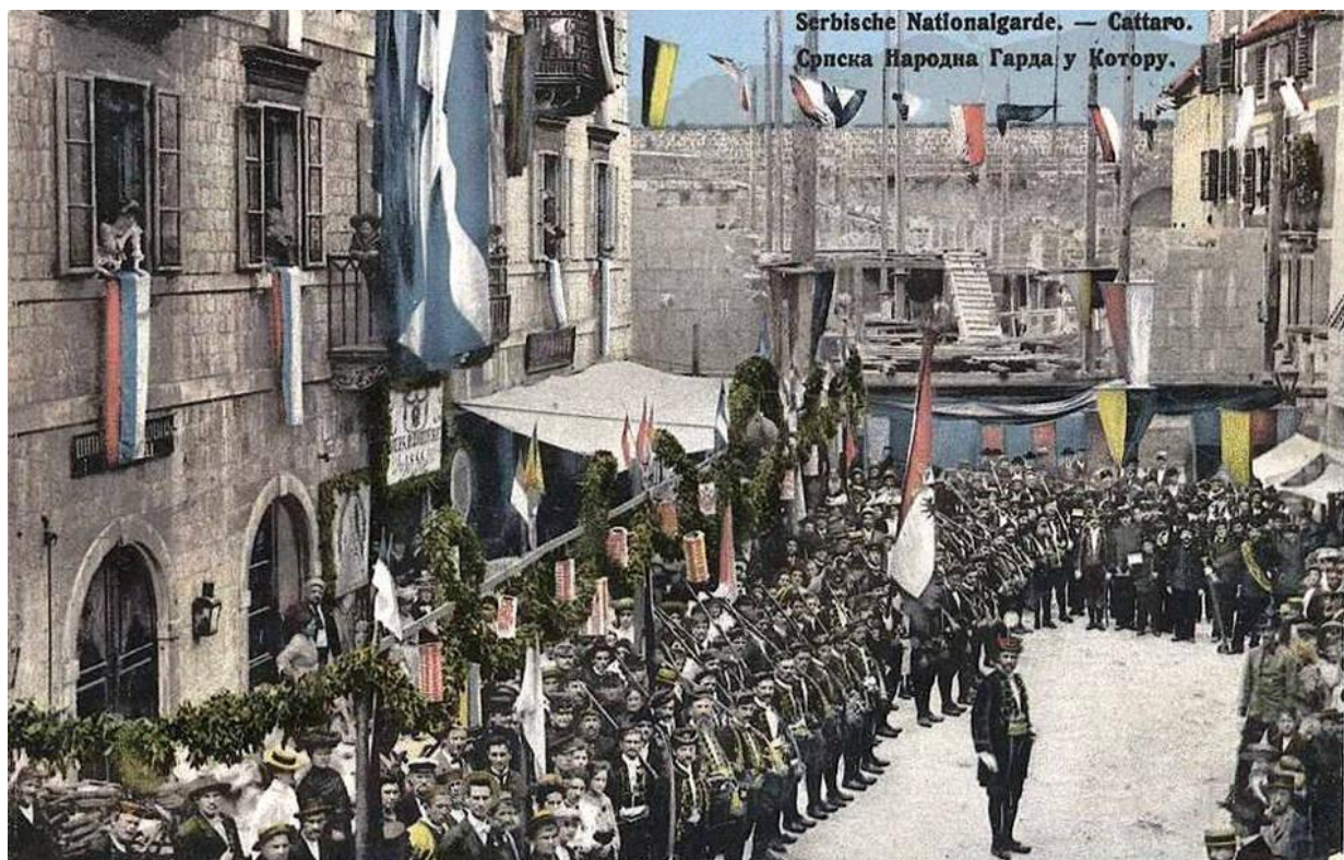
Српска гарда у Котору