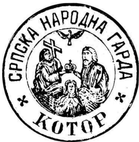
Печат Српске народне гарде из Котора