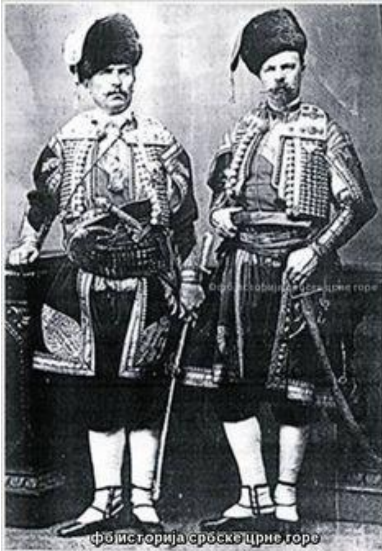
Чланови Српске народне гарде, Котор 1880. године

"Бокељска морнарица", старо братство помораца из Боке, постојала је од 809. год. Своју организацију је мењала према политичким приликама. Организована је у доба Венеције као самостално друштво, а у доба Аустрије учествује искључиво у црквеним свечаностима Светог Трипуна. Не сме се изједначити Бокељска морнарица са бокељским поморством.