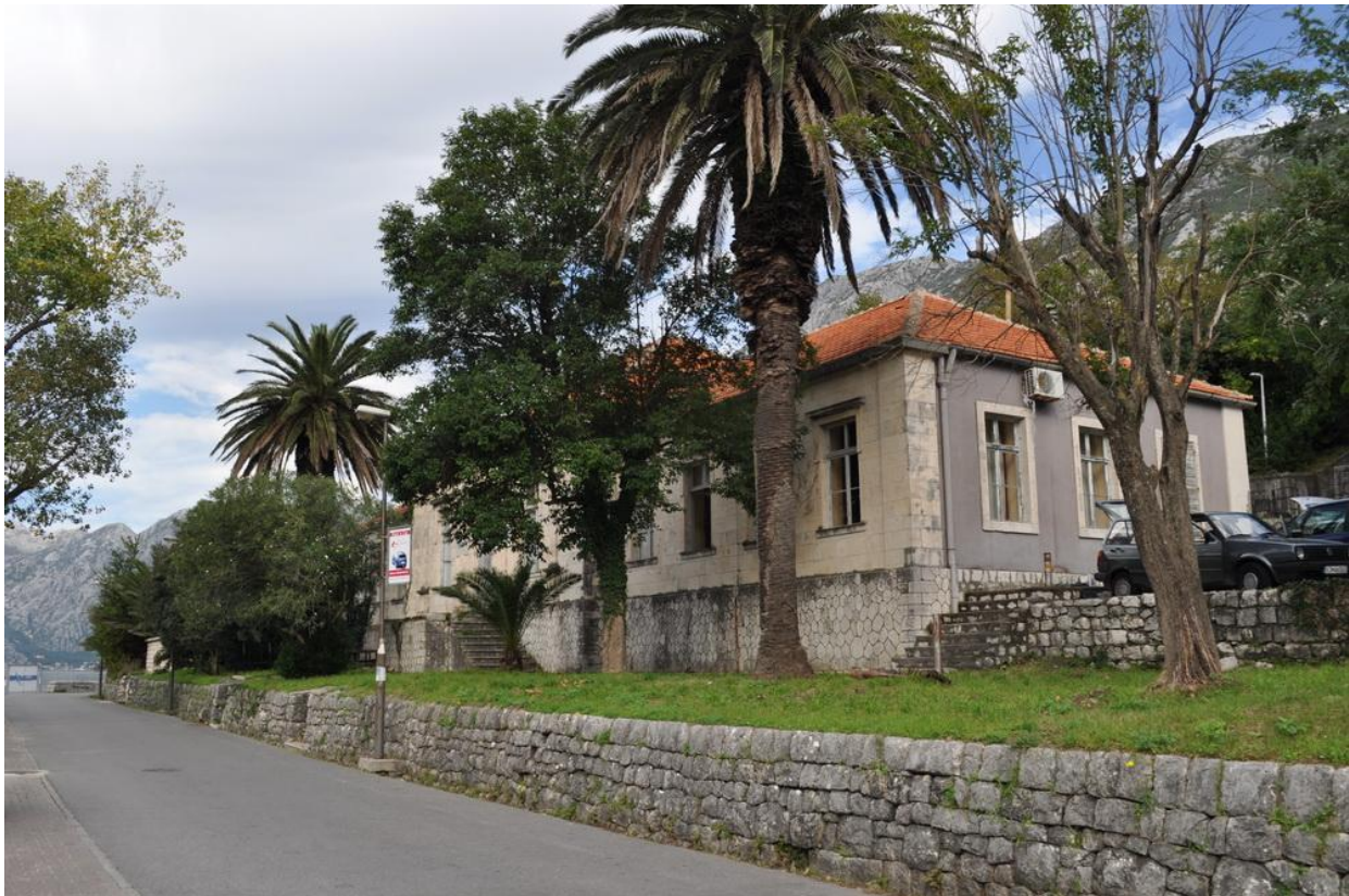
Славјанска читаоница у Доброти

Са истим циљем основана је и читаоница у Прчњу 1861. године и њени чланови су били махом поморски капетани. Следеће године то је учињено и у Доброти и Херцег Новом, где је 31. децембра 1894. године основана Српска читаоница. Тог дана оверен је Правилник српске читаонице, а већ 27. јануара на Савиндан почела је са радом Српска читаоница.