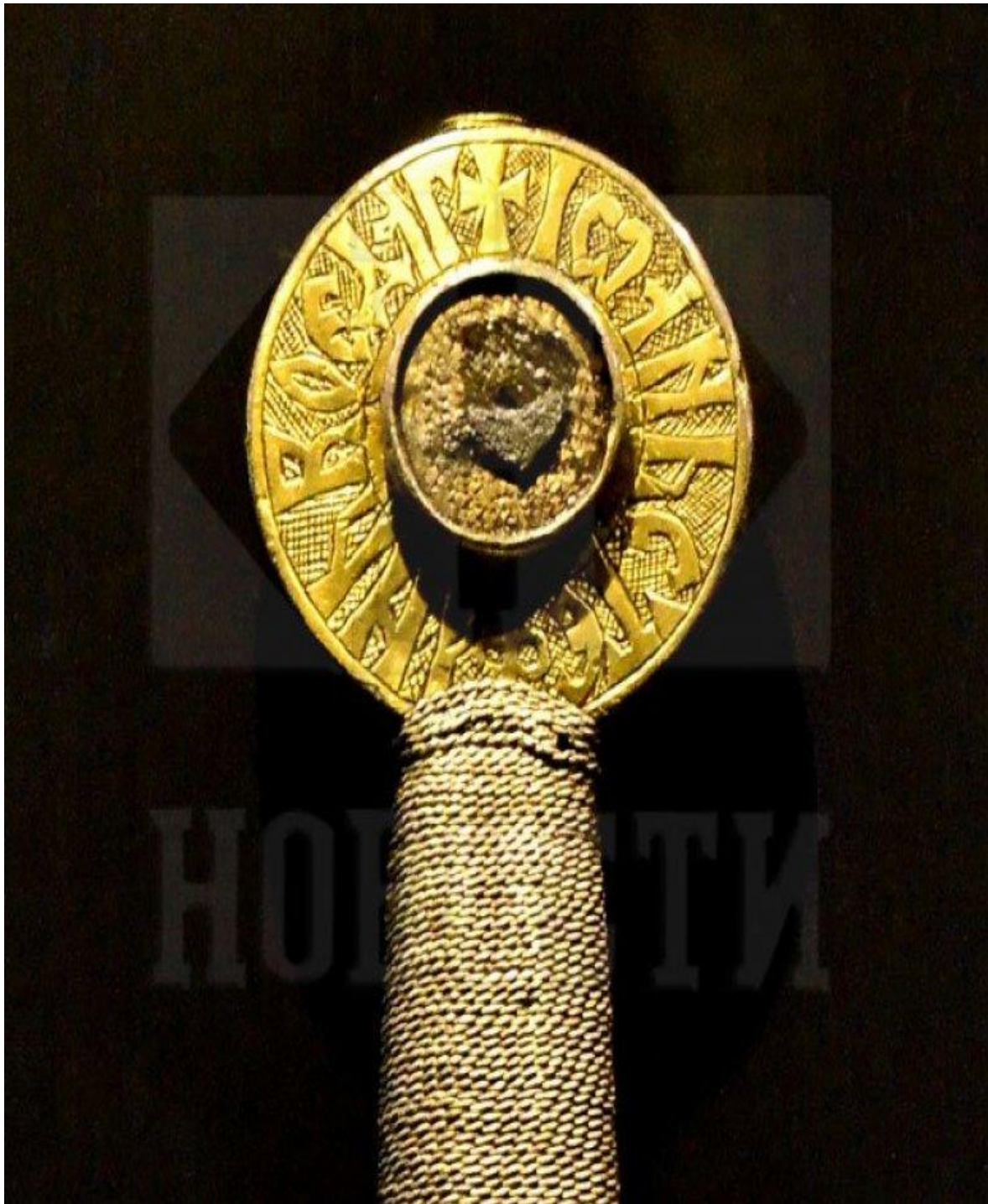
ЂИРИЛИЦА Мач српског војводе Стефана

Најупечатљивија личност и у османском и у српском миту, у потпуном нескладу са средњовековним стилем хроника које помињу само владаре је српски витез који је испунио обећање да ће убити султана по цену сопственог живота. Османски хроничари су му дали за источњаке узвишену титулу фedaјина која је означавала човека који се жртвује за веру и реч. Најраније османске хронике казују да је српски племић обливен крвљу устао из гомиле мртвих тела на бојном пољу и убио Мурата после чега је погубљен. У једном од описа стоји да "и Гази Мурат тада постаде шехид", што би значило да је хришћанин Обилић сматран такође мучеником за веру!