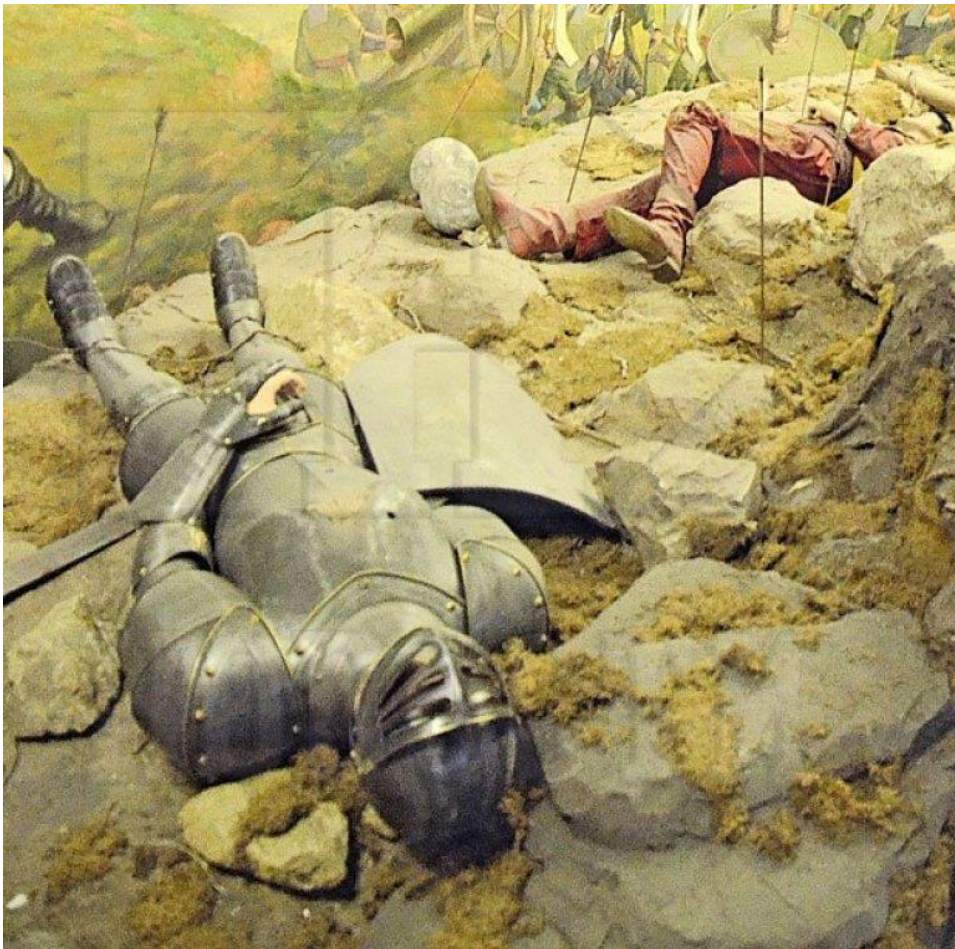
РАЗБОЈИШТЕ 3D приказ средњовековне битке

ТРАЖИЛИ смо од угледних српских историчара ширу причу о овом сведочанству, али они су били затечени информацијом објављеном 1880. која је измакла пажњи науке. Добили смо само потврду да је Бан био одличан познавалац османске Турске и уверење да је његово сведочење верно. Нашли смо и сведочанство османског хроничара Солакзадеа из 15. века који је посведочио да су оклопи Милоша Обилића и његовог бојног коња тада чувани у султановој ризници! То је било "зелено светло" да кренемо у потрагу за Милошевом руком и оклопом. Оскудни подаци су нас упућивали на Истанбул и ризницу у дворском комплексу Топкапи, а затим у Малу Азију, у Бурсу, где је Муратов син, султан Бајазит звани Муњевити, сахранио већи део очевог тела и сазидао над њим маузолеј.