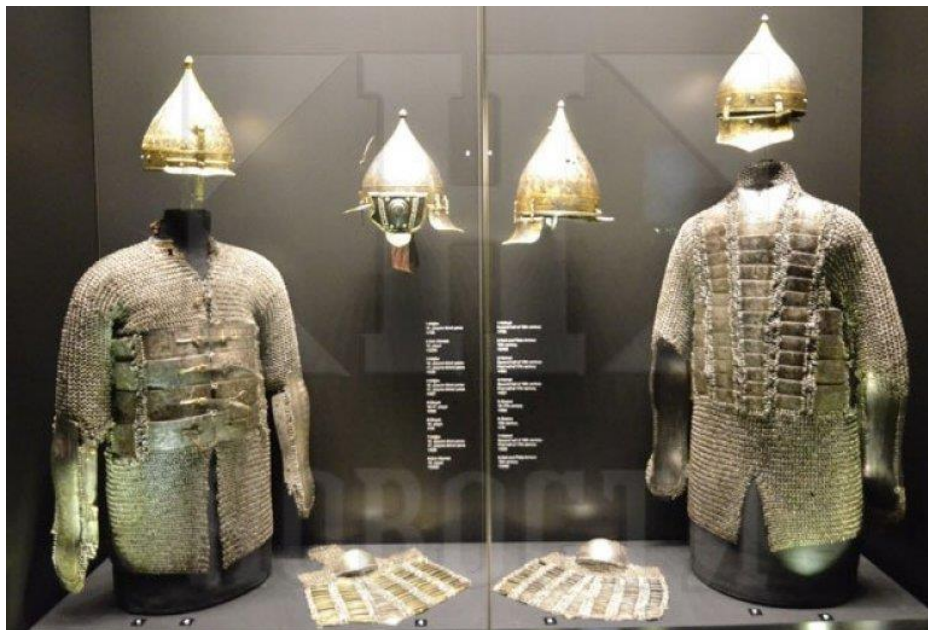
ЧЕЛИК Османски оклопи са плочама на стомаку и грудима

- Па шта још има? Ах, то је неоцениво! На том истом оклопу стоји обешена и једна у сребро окована рука! И на питање чија је то рука рекао је хећим: "Па то је рука Обилића који је цара Мурата ножем пробо!"