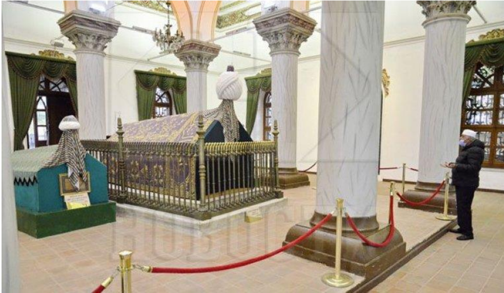
МАУЗОЛЕЈ Исламски верник крај стуба Муратове гробнице на ком је висила Обилићева рука

НОЋНО путовање ауто-путевима Србије и Бугарске прошло је за трен уз старе приче. Јутро смо дочекали на граничном прелазу Капикуле са кога је допирао зов муџезина, а на периферији Цариграда нас је зауставила неописива саобраћајна гужва. Из ње смо упали у хаос пешака који су као омађијани тумарали између базара, ресторана и туристичких атракција. Маратонско чекање у редовима испред билетарница дворског комплекса Топкапи избегли смо купујући електронску карту од 20 евра која омогућава брз улаз. У унутрашњем дворском дворишту, ушли смо у мрачну Горњу ризницу, крај одаја Царског савета. Она је сада музеј оружја и оклопа, османских и заплењених од хришћанских ратника. У тами су бљештали мачеви, сабље, бојне секире, кациге, али нашу пажњу су привукли султански оклопи. Дуге верижне кошуље по правилу имају металне плоче које штите стомак и средину груди и очигледан су доказ да чувени ратник Мурат није могао бити распорен ножем у шатору, већ само у боју вештим ударцем.