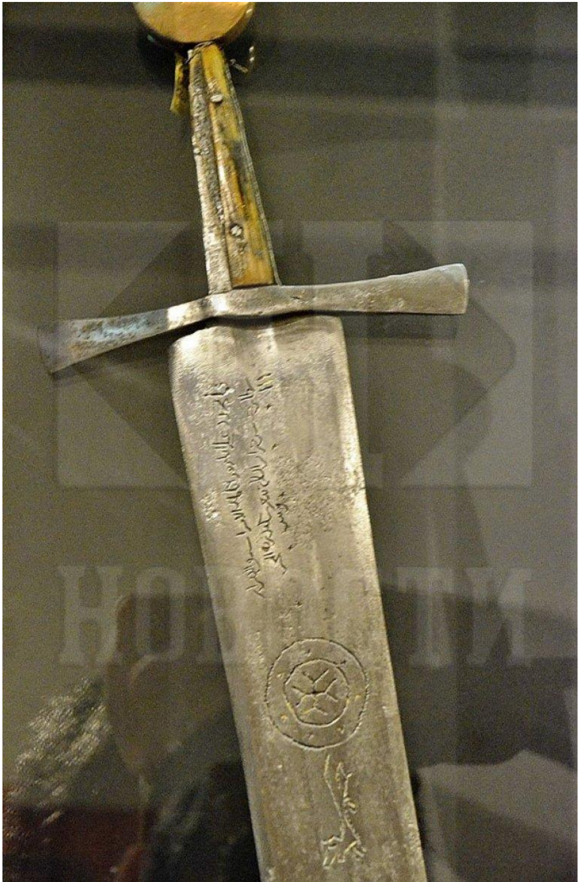
ВУКОВАЦ Српски мач из 14. века, Фото Б. Субашић