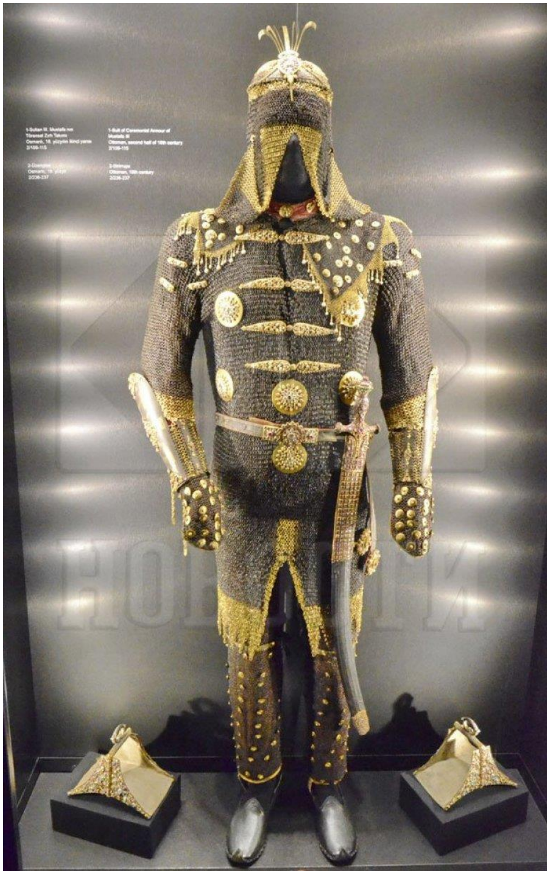
СУЛТАН Церемонијални оклоп владара, Фото Б. Субашић