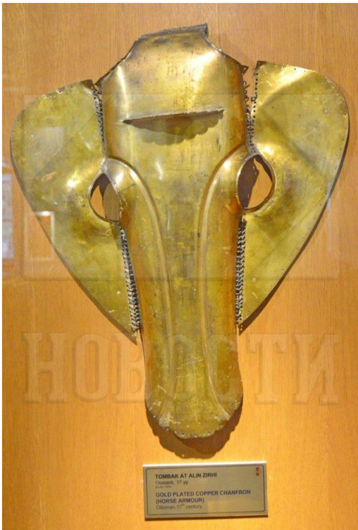
ПОЗЛАЋЕН Оклоп за главу коња, можда Обилићевог, Фото Б. Субашић