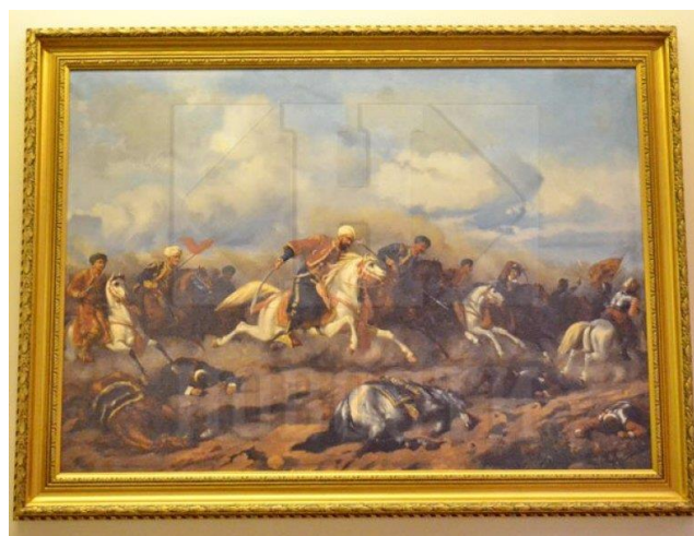
СЕЋАЊЕ Поставка о Косовском боју у истамбулском војном музеју са верижњачом Евренос бега

НОЋНО путовање ауто-путевима Србије и Бугарске прошло је за трен уз старе приче. Јутро смо дочекали на граничном прелазу Капикуле са кога је допирао зов муџезина, а на периферији Цариграда нас је зауставила неописива саобраћајна гужва. Из ње смо упали у хаос пешака који су као омађијани тумарали између базара, ресторана и туристичких атракција. Маратонско чекање у редовима испред билетарница дворског комплекса Топкапи избегли смо купујући електронску карту од 20 евра која омогућава брз улаз. У унутрашњем дворском дворишту, ушли смо у мрачну Горњу ризницу, крај одаја Царског савета. Она је сада музеј оружја и оклопа, османских и заплењених од хришћанских ратника. У тами су бљештали мачеви, сабље, бојне секире, кациге, али нашу пажњу су привукли султански оклопи. Дуге верижне кошуље по правилу имају металне плоче које штите стомак и средину груди и очигледан су доказ да чувени ратник Мурат није могао бити распорен ножем у шатору, већ само у боју вештим ударцем.