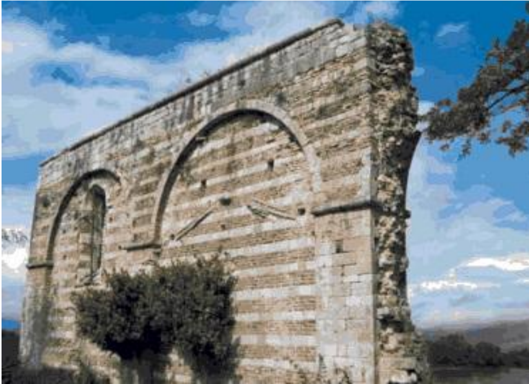
Црква Св. Срђа и Вакха, село Ширћ – Скадар (на обали реке Бојане) – цркву подигла Јелена Анжујска (жена Краља Уроша I) 1290. године – цркву обновио њен син Милутин 1311. године. На слици: остаци јужног зида

– У последњих сто година ово место је веома пропало – прича Поповић.