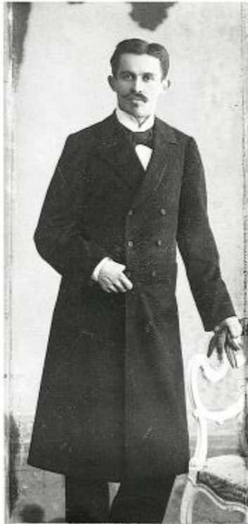
Јован Скерлић (1877-1914)

Један од водећих таквих културних званичника Краљевине Србије прије Првог свјетског рата је био Јован Скерлић који се залагао својим револуционарним идејама, као и римокатоличка мисија , да се „зарад југословенства Срби одрекну ћирилице, а Хрвати ијекавског изговора и да пређу на екавски“ . У својој Историји, у којој је, узгред, негирао умјетничке вредности српске православне средњовековне књижевности, пише, „старе се преграде руше, стапају се народи и културе једне српско-хрватске књижевности“.