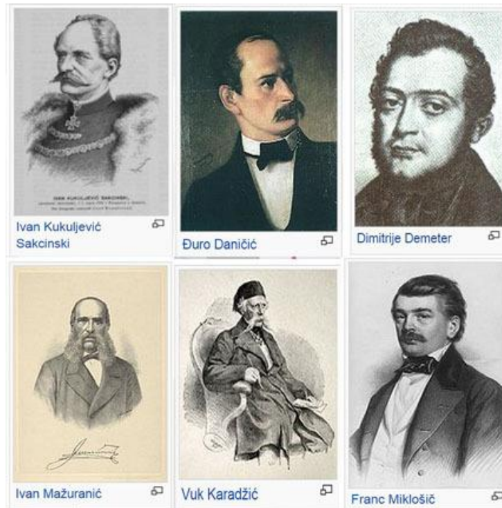
Учесници Бечког књижевног договора

Римокатоличка мисија у Хазбуршкој монархији је радила на приближавању Срба Хрватима кроз југословенску језичку политику српско-хрватског јединственог народног језика.