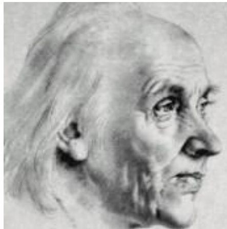
Jernej Bartholomaeus Kopitar (1780-1844)

„Његоша је прихватио и народ, али њихов пут, њихов правац, њихов језик, нису прихваћени у нашој књижевности. Још ни до данас није задовољавајуће испитана посебност Његошева језика, и овај велики пјесник се у том погледу не издваја између осталих. Често се чак везује за дух и суштину наше књижевности, а не уочава се други, другачији пут којим иде његова поетска мисао. Можда зато у XIX веку постоји низ добрих писаца, али само један Његош. “