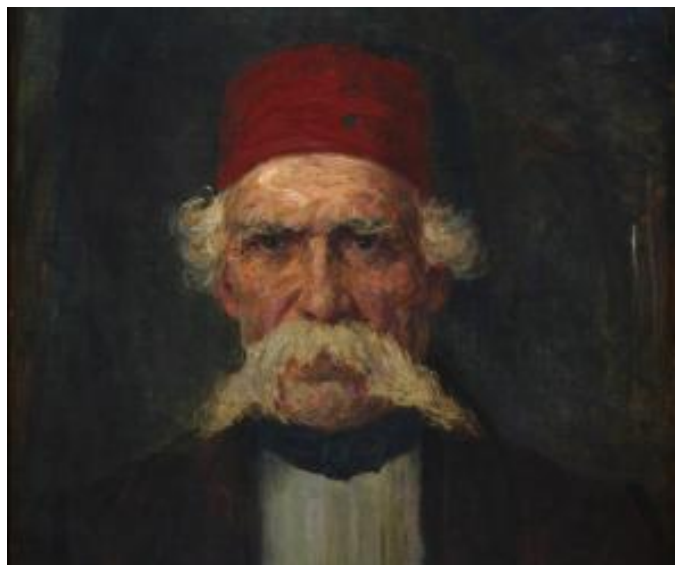
Вук Стефановић Караџић (1787 — 1864)

Бечки књижевни договор о двоименовању српског језика је примјењиван на подручју хазбуршке монархије у различитим варијантама али са истом суштином. Југословенски језички пројекат су истовремено користиле и револуционарне организације за своје циљеве.