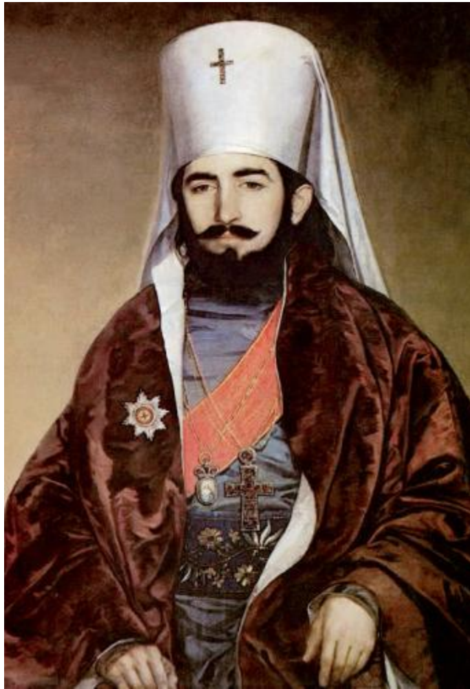
Владика Петар II Петровић Његош (1813 – 1851)

Однос Вука Караџића и Владике Петра II Његоша можемо посматрати као однос Вукове реформе и православне цркве. Иако постоји устаљено мишљење да су Вук и Његош били другови по перу и идејама, однос Вука и Његоша је програмски површно представљан, а прећуткивана су њихова суштинска мимоилажења, док је однос Вука и Доситеја Обрадовића програмски представљан као ривалитет два европска идеолошки правца између којих је пожељно да се Срби одређују.