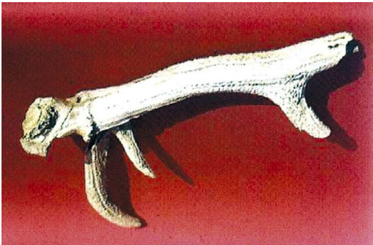
Алат за копање коришћен јеленски рог

Она открива да је смрт прекинула академика Драгослава Срејовића, који је открио Лепенски вир, у истраживању још једног локалитета који је наговештавао сензацију.