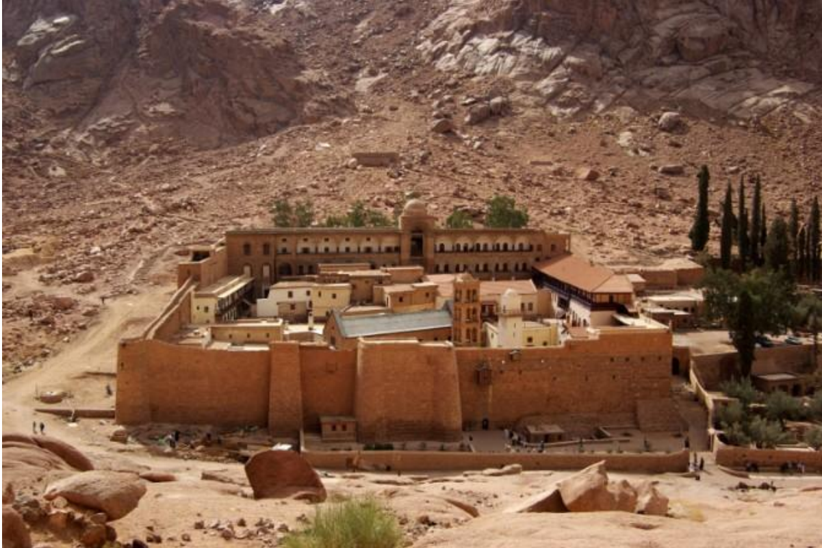
Манастир Свете Катарине на Синају.

Не само што су тако многа вредна и стара дела сачувана, него су и нова могла да наставе да се израђују. Нећете веровати, али муслимани нису дирали ни манастир ни братство; кажемо “нећете веровати”, мада свако ко ишта зна о историји раног ислама, зна и да ови данашњи исламисти са њима скоро никакве идеолошке везе немају.