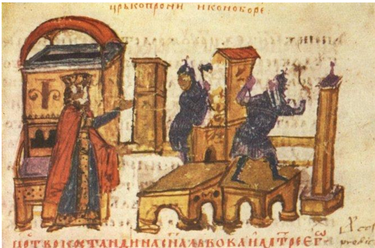
Уништење цркве по наредби иконоборачког византијског цара.

У том тренутку, то се чинило као најавна смака света, али када је 726. цар Лав III отпочео иконоборачку политику уништавања свих икона и фресака због уверења њега и многих верника у источној Цркви да се ради о погрешној пракси због које је Бог одлучио да казни хришћане исламом, мишљење братства се сигурно променило.