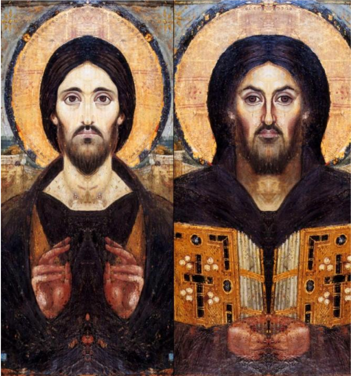
Овако би изгледала икона Христа Пантократора из Синајској манастира, са две божанске и две људске стране лица.

Причамо о две природе у личности једног Исуса Христа, у коме постоје две природне воље и енергије, савршено и тајанствено сједињене у јединственом субјекту. Једна је божанска, по којој је једносуштаствен Богу (којег је један од три саставна и неодвојива дела), а друга је људска.