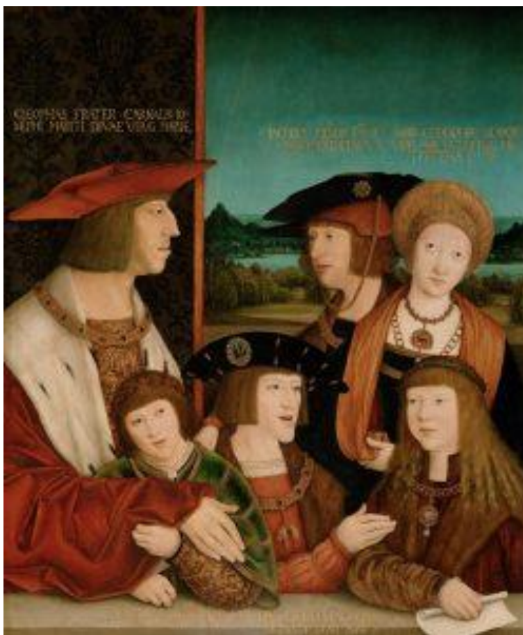
Максимилијан I Хабзбуршки са супругом Маријом од Бургундије и потомством.

Када је умрла неколико година касније, Хабзбурзи су постали једини наследници; успешно изашавши из спора око те територије, који је имао са краљем Шарлом VIII од Француске, Максимилијан (који је 1486. постао краљ Немачке) је Санлиским споразумом 1493. године обезбедио свом и Маријином сину Филипу Лепом титулу војводе Бургундије.