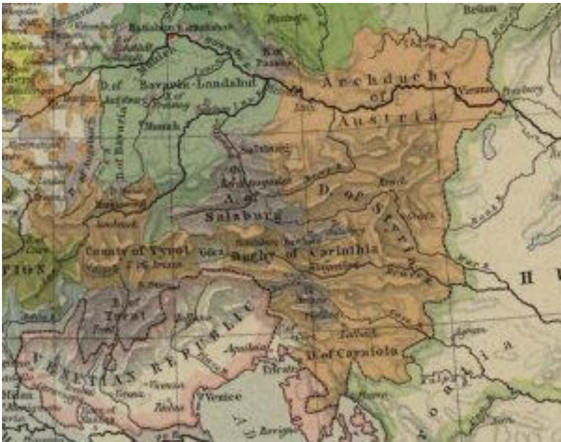
Надвојводство Аустрија у оквиру наследних хабзбуршких земаља обојених у наранџасто, у години 1477.

Фридрих ће, пак, као император, преузети водећу улогу у фамилији, постављаће се као судија у унутарпородичним сукобима и обновиће јединство аустријских земаља (1379. године дошло је до поделе на две линије, албертијанску и леополдијанску) након изумирања албертијанске линије, и додатно након изумирања тиролске гране леополдијанске линије.