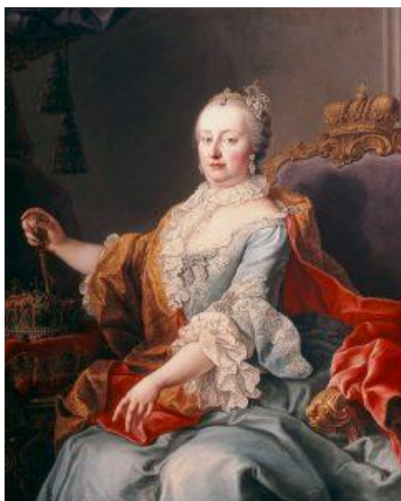
Царица Марија Терезија из династије Хабзбург.

Међутим, пре него што наставимо, неколико ствари треба објаснити, јер је ово изузетно значајан период. Изумирање Шпанских Хабзбурга изазвало је Рат за шпанско наслеђе који се завршио крунисањем Филипа, унука краља Луја XIV од Француске, за новог шпанског краља.