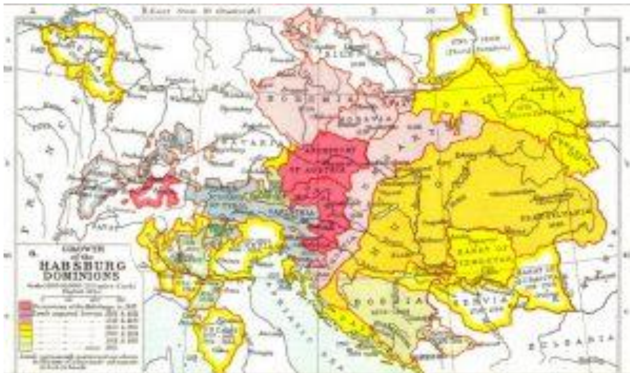
Успон Хабзбурга у Средњој Европи.

Максимилијанова владавина, која је потрајала све до 1519, тако је довела до велике експанзије хабзбуршке моћи; већ 1497. његов поменути син Филип Лепи се оженио Хуаном од Кастиље (позната и као Хуана Луда, због своје опсесивне љубави према супругу, због које је уосталом и изгубила разум, у медицинском смислу) која је била наследница краљевстава Кастиље и Арагона, укључујући и поседе у Америци.