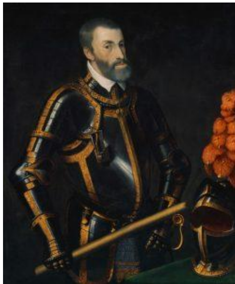
Свети римски цар Карло V Хабзбуршки, који је такође био и краљ Шпаније и владар многих других држава. Његови поседи су се протезали над 4 милиона квадратних километара.

У наредној генерацији Хабзбурга, Карло V ће доживети да буде "светски император": не само што ће бити свети римски цар и надвојвода Аустрије, већ ће бити и краљ Кастиље са свим колонијалним поседима које је то са собом носило, краљ Арагона са свим поседима те круне (између осталог, Напуљ, односно цела јужна Италија), надвојвода Милана, војвода Бургундије (дакле, држаће и низоземске покрајине), и тако даље. Он је први човек за чију се империју говорило да "Сунце над њом никада не залази", будући да је владао над четири милиона квадратних километара (!!!).