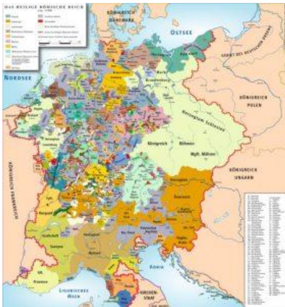
Карта Светог римског царства око 1400. године. Оно није било империја у уобичајеном смислу те речи. Више је било конфедерација.

1440. године, горепоменути Фридрих изабран је од стране кнежева-електора да наследи Алберта II као краљ Немачке (званично, од 12. века се владар Немачког краљевства називао краљем Римљана). Као што смо већ рекли, ова титула је била на неки начин увод у империјалну титулу, али се ниједан хабзбуршки краљ Немачке није ње докопао.