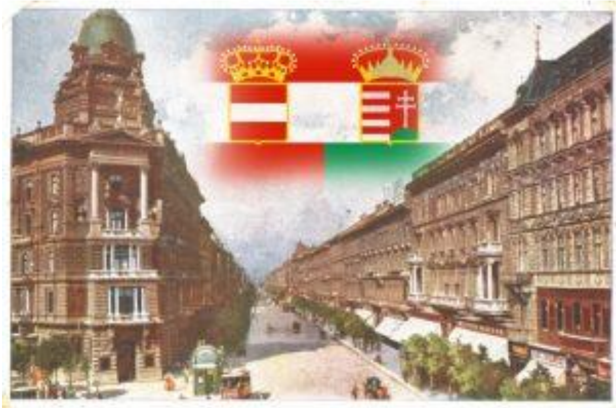
Цивилна застава Аустроугарске која није имала државну заставу. Авенија Андраши у Будимпешти из тог периода

То је и природно: људима је увек најбитније оно што се десило у скорије време, а оно што је давније може да се памти али неће играти претерану улогу у томе да ли сте у љубави или мржњи.