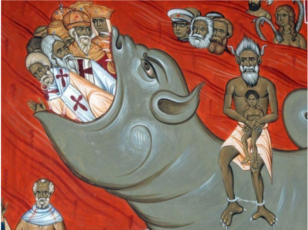
Фреска: Маркс и Енгелс у паклу

У којим научним, философским и психолошким сферама и чињеницама треба тражити позадину и исходиште овакве необичне „енологије“ у делима теоретичара научног социјализма и твораца комунистичке идеологије?