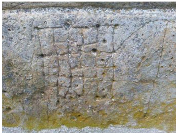
Српски годишњи календар из Тршке цркве