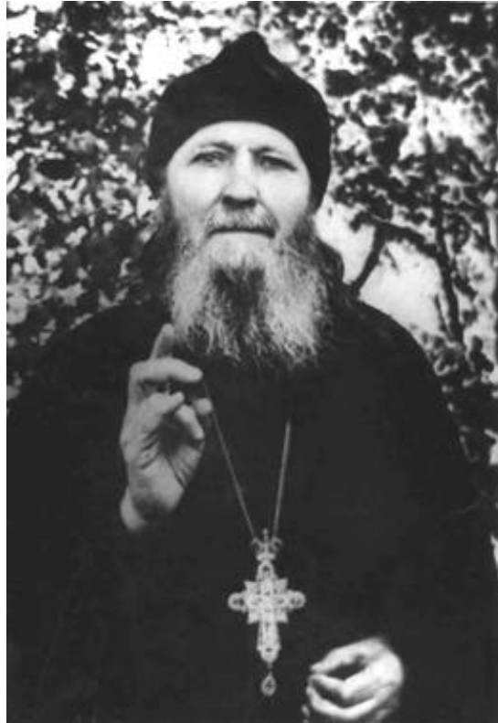
СТАРАЦ САВА ПСКОВО-ПЕЧЕРСКИ