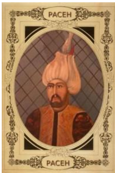
Мехмед паша Соколовић

Ђурађ Кастриот ( 6. мај 1405. Сина – 7. јануар 1468. Љеш ) познатији као Скендербег је био албански национални херој а многи у Албанији га сматрају оцем Албаније . Порекло Скендербега води из Зете. Његов отац Јован који је дошао у Јањину као српски кефалија се називао принцом Епира а његова мајка Војислава је имала племићко порекло. Када је Скендербегов отац изгубио битку против Бајазита I, Скендербег је заједно са својом браћом одведен у Турску. Током боравка у Турској добија име Скендербег и прима ислам. Сам Скендербег је ипак био велики противник Отоманског царства што га је довело до тога да покрене борбе против Турака. Свој поход против Отомана започиње у Албанији а касније се прикључује и у борбама у околини Ниша. Због борби против Османлија глорификовала га је и католичка црква. Истакао се и у другим борбама међу којима су и рат са Венецијом и Млетачком Републиком. Након опсаде Кроје, Скендербег оболева од маларије и умире у 62. години. Скендербег се у документима среће и под другим именима а постоје и списи у којима је Скендербег на српској ћирилици уписан под именом Ђурађ. Без обзира на ове чињенице у Албанији га сматрају етнички чистим Албанцем.