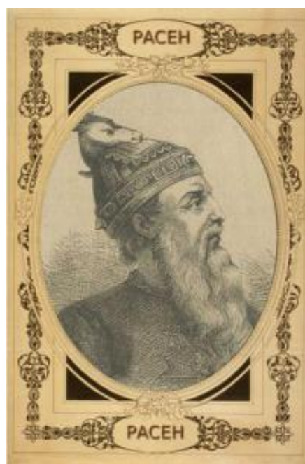
Ђурађ Кастриот Скендербег

Своју војну каријеру је почео код жупана Стефана Лазаревића да би касније прешао у војску краља Жигмунда. Као војсковођа Хуњади се увек борио на страни хришћана тако да је његово име битно не само за Мађарску већ за цело ово поднебље а посебно за Румунију и Србију . На територији Србије се борио у неколико битака међу којима је најзначајнија битка за одбрану Београда у којој је учествовао заједно са својим старијим сином Ласлом . Током рата у Београду је избила куга од које је оболео и сам Хуњади. Преминуо је 11. августа у Земуну који је тад припадао Краљевини Угарској . Због својих борби против Турака на овим просторима сматра се највећим хришћанским војсковођом па стога ужива велику популарност. У Мађарској је проглашен за народног хероја а због својих заслуга то звање носи и у Румунији . У српским народним песмама је познат под именом Сибџанин Јанко а у литератури и као Јован Хуњади.