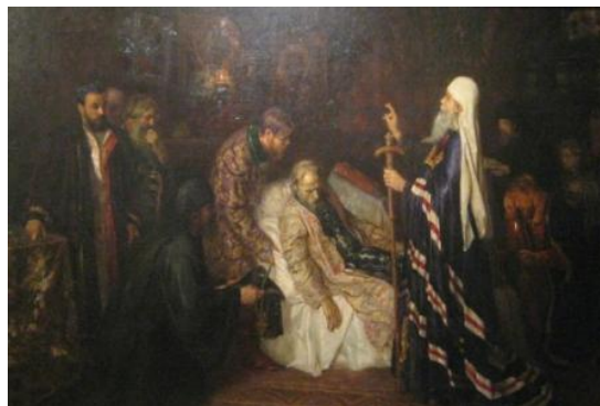
Иван Грозни прима схиму пред смрт.