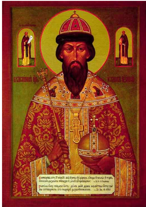
Мироточива икона св. цара Ивана Страшног

Први Цар на Руси, који је прихватио наслеђе православне империје РOMEЈА (Византијске) и који је на делу остварио концепцију „Москва-Трећи Рим: