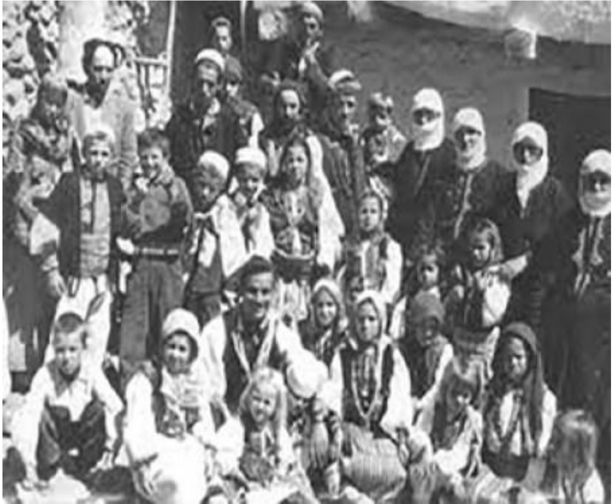
Стара фотографија Горанаца

Као сви други муслимани, и Горанци празнују Рамазан и Курбан-бајрам. Обележавају и Аиуре, као и Дељење, када се за покој душе преминулих дели алва.