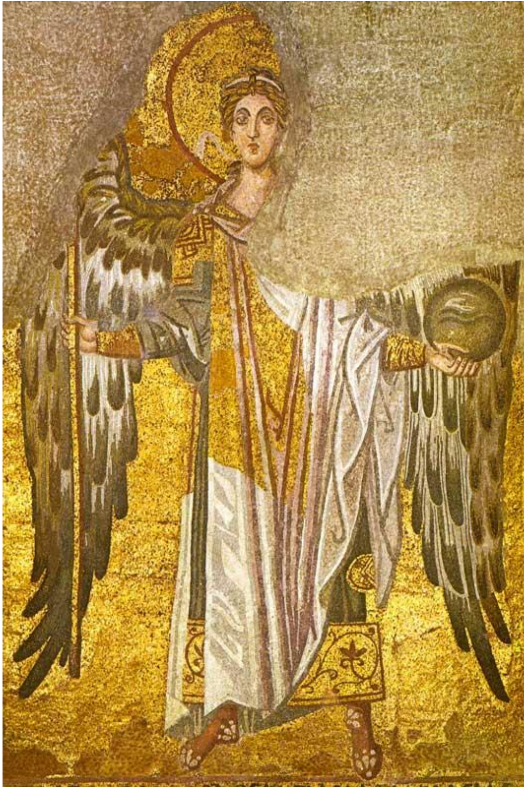
Анђео из Свете Софије, Константинопољ

Ова краљица Софија и њен ковчег су повезани, по Турским легендама, са заповешћу која постоји вековима до данас. Ова заповест налаже да нико не сме да узнемирава ковчег, чак ни да га дотакне. Ако се нешто слично деси, онда ће по легенди то изазвати васкрсавање краљице Софије. Ако дође до тога, онда ће застрашујућа бука уздрмати целу конструкцију цркве, покрећући сеизмичке догађаје који ће уплашити Турке.