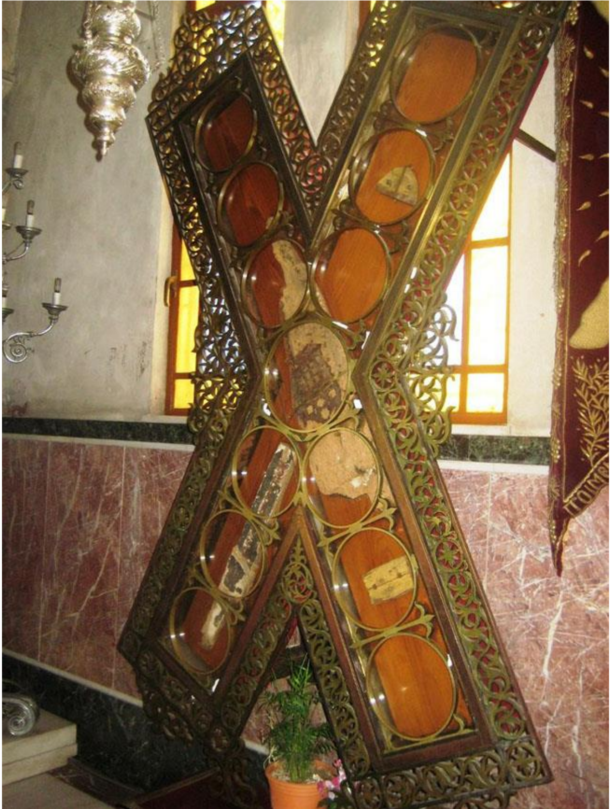
Крст Светог Андреја Првозваног