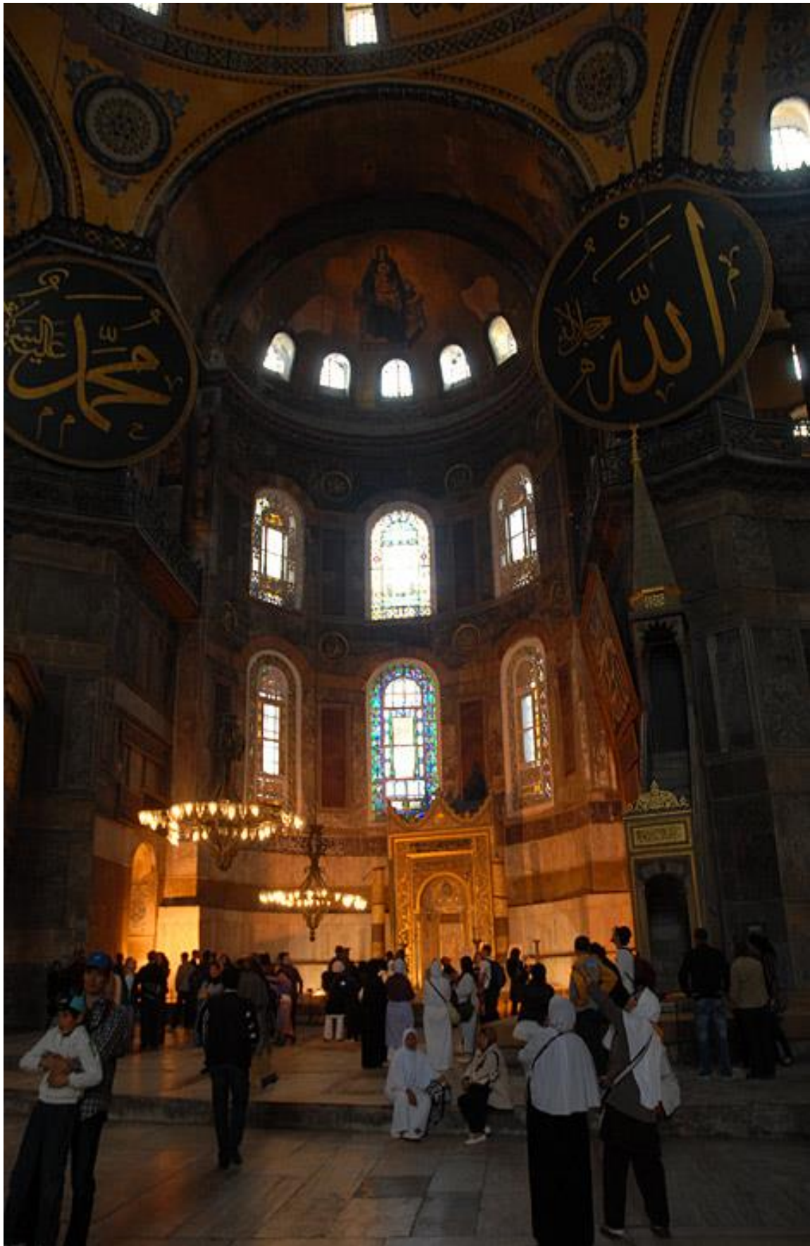
Олтарска апсида Свете Софије, Константинопољ