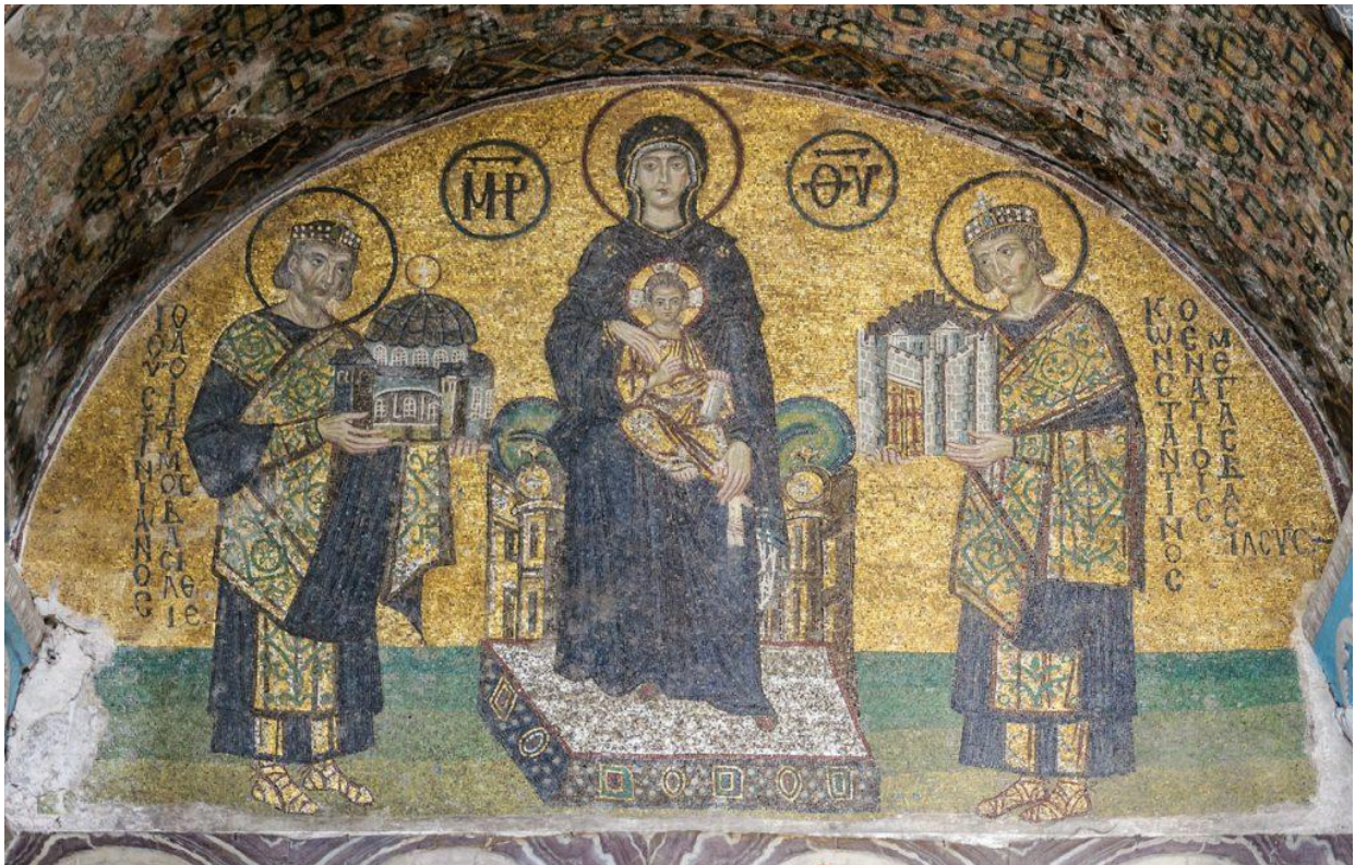
Богородица с малим Христом – мозаик, Света Софија, Константинопољ

Први значајан елемент преузет из тог чланка је неописив страх који је откривен код Турака у вези са скривеним крстовима, како симболичким тако и несимболичким крстовима, који су пронађени у унутрашњости ове цркве, а такође су виђени на основи Цркве одозго. Зато Турци изражавају велико страхопоштовање за познати „Крст Апостола Андреја” (Светог Андреја Првозваног). Као што је познато, он је оснивач Цркве у Константинопољу. Како пишу новине, Крст Светог Андреја откривен је на крову цркве урезан дијагонално. То је значајан симбол који не само да није изгубљен током векова Турске окупације, него доминира простором својим симболичним значењем.