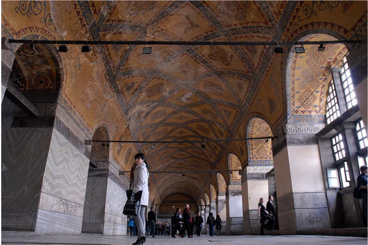
На спрату, Света Софија

Посебни значај се придаје мозаику који показује познате византијске царе, као нпр. Јована Комнина са Исусом Христом и цара Константина Мономаха са царицом Зои. Сви ови цртежи изазивају изузетно страхопоштовање према грчкој православној Великој цркви и унутрашњој снази која избија из ових мозаика. Они су створили различите легенде о њиховом есхатолошком симболизму.