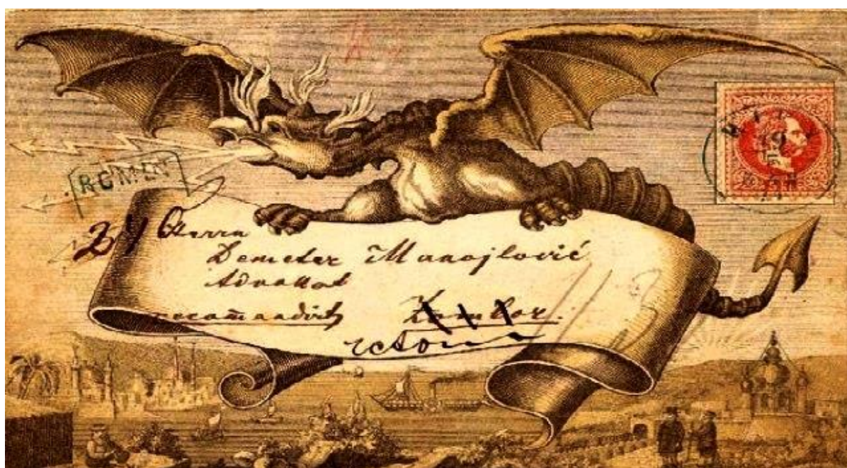
Прва разгледница на свету, штампана у редакцији часописа „Змај“ у Бечу 1871. године

Прва права разгледница на свијету, тврде картофили, штампана је на српском језику ћиричним писмом 1871. године у уредништву листа „Змај“ у Бечу.