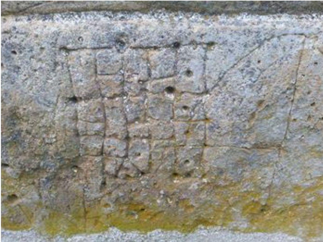
Српски годишњи календар из Тршке цркве

Показује да су Срби били један дуг период под римском окупацијом и услед снажног утицаја латинског језика прихватили латинску реч за један од својих највећих празника. Затим, показује да је на Балкану настао старословенски језик и одавде се ширио на север. Показује све шта се они труде да сакрију.