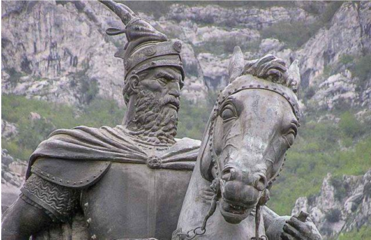
Ђурађ Кастриот Скендербег

Питао сам се тада зашто су подигнуте монументалне скулптуре коњаника Скендербега најпре у Тирани, потом у Приштини и Скопљу, а никада у престоним градовима у Србији или Црној Гори?