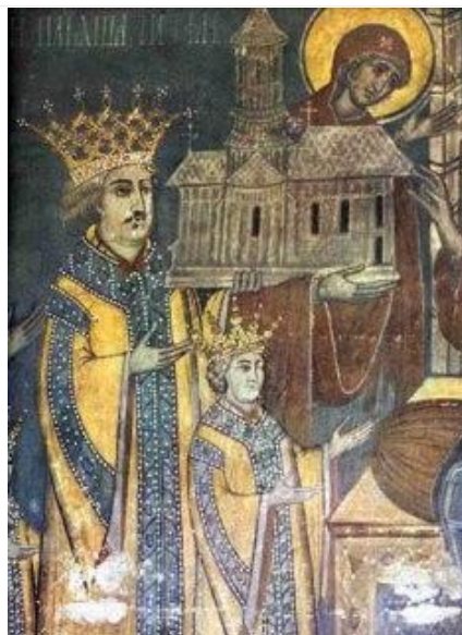
Петра IV Рареша

Нагој је између осталих добротинастава, помогао Максиму и Ангелини Бранковић да подигну манастир Крушедол у Срему. Нагој и Деспина су имали петоро деце, три сина и две кћери. Сачуван је Деспинин вез („фелон“) за цркву у Крушедолу на коме је извезла имена чланова своје породице, са датумом „15. јуни 1519.“ (годишњица Косовске битке). Нагоја је, накратко наследио син Јован Теодосије, ког су Турци одвели у Цариград и погубили (1521). На једној икони Богородице, коју је наручила Деспина, стоји натпис „Владичице, прими душу раба твојега Јована Теодосија војводе и принеси му суд. Госпођа Деспина.“ Две Нагојеве и Деспинине кћери су такође биле румунске владарке: Роксанда је била удата за Радуа Афуматија (био пет пута проглашаван за влашког војводу у периоду 1522-1529) са којим је имала сина који је такође постао влашки војвода (Раду Илие, владао 1552-1553) док је друга кћи Стана, удала се за молдавског владара Стефана VI. Деспина је дуго надживела мужа и децу. Покалуђерила се и као монахиња Платонида умрла 1544. године. Две године након смрти, њене земне остатке је влашки митрополит пренео у ктиторски манастир Куртеа де Арђеш, где и данас почива уз мужа и децу.