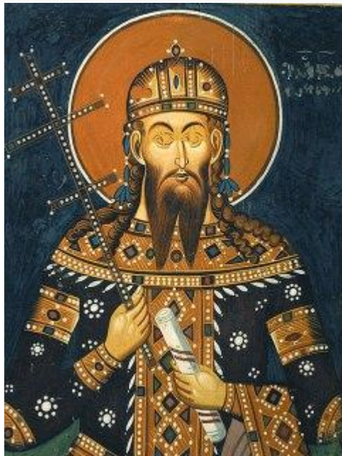
Стефан Урош V Нејаки