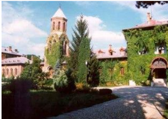
Манастир Куртеа де Арђеш

Максимов брат и последњи деспот из породице Бранковића – Јован (1496-1502) венчао је своје две кћери у Влашку, односно у Молдавију. У Влашкој је за војводу Басарабу Нагоја (владао 1512-1521) била је удата Милица Деспина. Басараб Нагој је потицао из бојарске породице Крајовешти, која је тврдила (без поузданог основа) да представља млађу (ванбрачну) грану породице Басараб. Владао је у време највећег успона Отоманског царства (у време султана Сулејмана „Величанственог“) чију је врховну власт признавао. Био је врло образован, покровитељ цркве и оснивач многих манастира. Написао је једно од првих литерарних дела на румунском језику, под називом „Поука Нагое Басараба своме сину Теодосију“, у ком су обухваћене разне теме из области филозофије, дипломатије, морала и етике. Са супругом Деспином, основао је чувени манастир Куртеа де Арђеш, у тадашњој влашкој престоници, у коме се може и данас видети њихов ктиторски портрет.