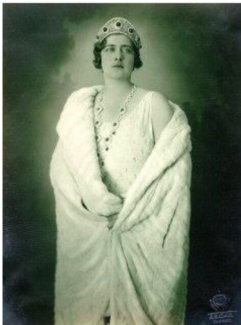
Краљица Марија Карађорђевић

Пошто је потицала из најчувенијих владарских породица, краљица Марија има врло дугачак и прецизно утврђен родослов. На пример, познати су нам њени директни немачки преци по мушкој линији (тј. преко њеног оца) у чак 27 генерација – све тамо до првог грофа Бурхарта „фон Цолерна“ из XI века. Међутим, посебан куриозитет представља родослов краљице Марије Карађорђевић по директној женској линији (тј. преко мајке па матрилинеарном линијом – дакле преко мајчине мајке, затим мајчине бабе по мајци и тако даље) који дајемо у прилогу. Праћењем овог родословног „пута“, након равно 29 генерација стижемо директно до царице Еуфрозине, жене византијског цара Алексија III Анђела и таште првог србског краља Стефана Првовенчаног Немањића. Наиме, цар Алексије III и жена му Еуфрозина имали су три кћери. Једна од тих кћери (Евдокија) удала се за Стефана Првовенчаног са којим је имала синове (србске краљеве) Радослава и Владислава. Друга кћи (Ана) удала се за византијског цара Теодора Ласкриса и постала, након осам векова и равно 29 рађања девојчица (кћерке-мајке), директни женски предак краљице Марије. Са краљицом Маријом, која није имала женске деце, овај матрилинеарни низ се прекида. Као што је познато краљ Александар и Марија су изродили три сина (краља Петра II, Томислава и Андреја). Као и њена румунска претходница, краљица Наталија Обреновић, и краљица Марија Карађорђевић је умрла као избеглица изван Србије – 1961. године у Лондону.