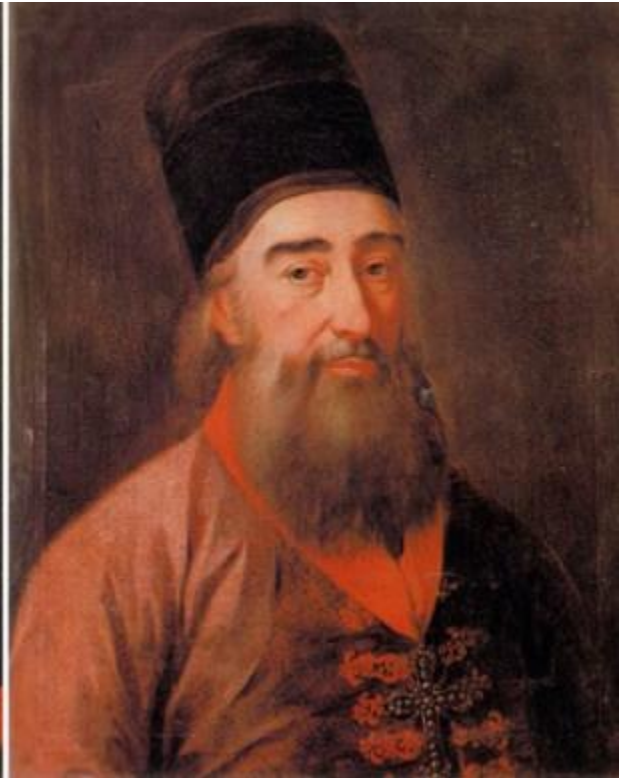
Митрополит Павле Ненадовић

Српско задужбинарство није нестало после пада деспотовине у 15. веку, већ је ношено као заветни ковчег у сеобе, кад су бескрајни збегови кренули према сигурности високих динарских планина и преко Саве у Угарску.