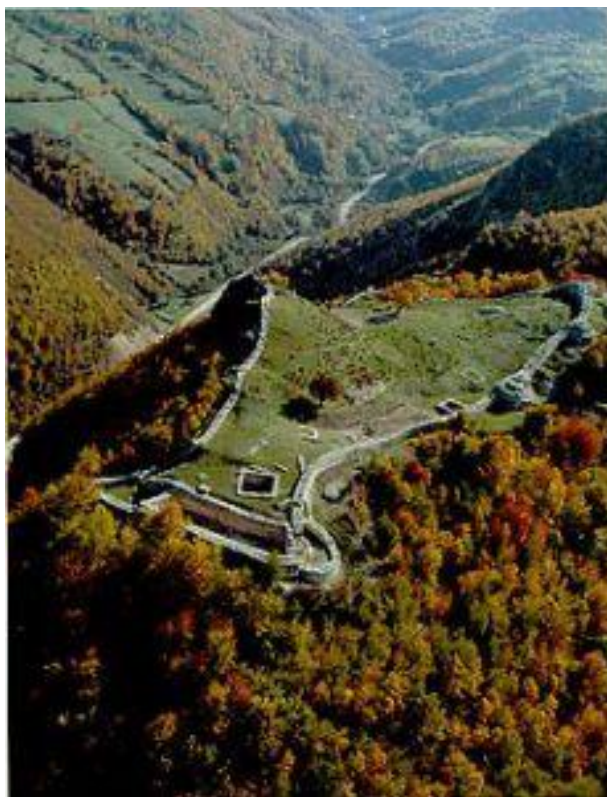
Стари Рас са Сопоћанима;