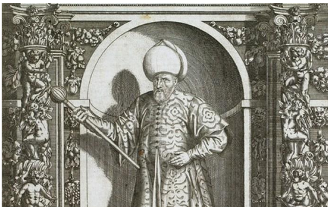
Мехмед паша Соколовић

„до времена Макарија патријарха који је од брата свога великога везира турског царским хатишерифом све манастире и цркве обновио. Нешто ближе вести о односима Мехмеда Соколовића са српском хришћанском јерархијом налазимо у дневнику Стефана Герлаха који је од 1573. до 1578. године боравио у Цариграду. Именовани је у свом делу 4. априла 1577. године забележио следеће: „био сам у Патријаршији где сам видео архиепископа охридског и све Бугарске, човека од 50 година у лошој калуђерској ризи, 2. митрополита родоског, човека од 40 година са црном брадом, 3. архиепископа пећког и целе Србије, од 40 година и Мехмед-пашиног најближег рођака“. Употребивши синтагму „Мехмед-пашин најближи рођак“ Стефан Герлах је мислио на синовца патријарха Макарија, пећког архиепископа и патријарха српског Герасима.