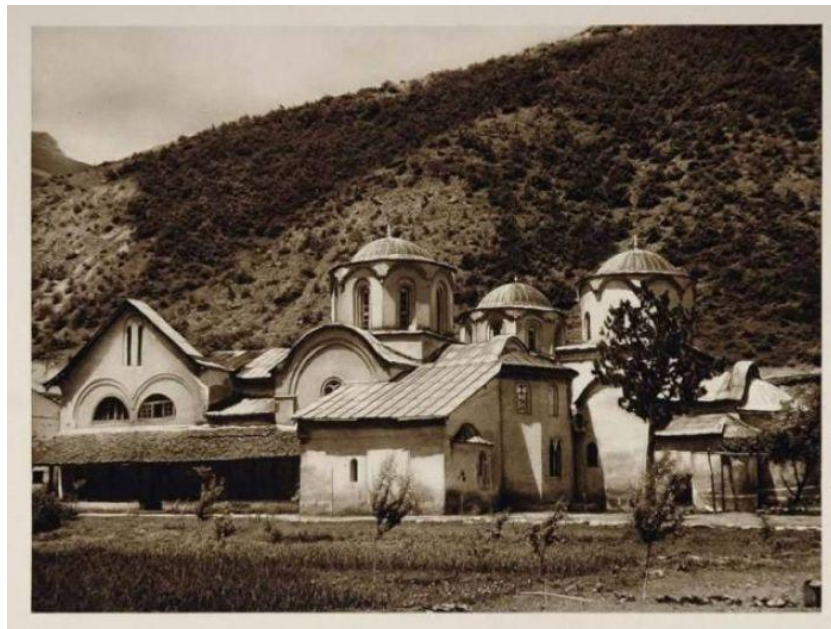
Пећка Патријаршија; слика из 1926. године

Патријарх Макарије је спроводио опсежну градитељску делатност. Обновио је храм на патријаршијском имању у Будисавцима близу Пећи (1568), дозидео је припрату у Пећи (1561) и саградио је припрату манастира Грачанице (1570). Патријарх је био велики љубитељ књиге и писане речи. Увиђајући потребе цркве, која је у тим временима оскудевала у броју богослужбених књига, наредио је да се организују штампарије у Милешеви, Мркшиној Цркви и Скадру, које су имале већу продукцију литургијских књига него што би то давало преписивање.