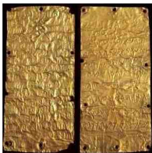
Етрурске златне таблице из Пирга

Због тога се она често назива културом урнених поља (нем. Urnenfelderkultur, енгл. Urnfield culture). Између 10. – 6. века п.н.е. становници ових места у историјским изворима, називају се Венети , а неколико стотина година називају се Венеди, Венди и Винди .