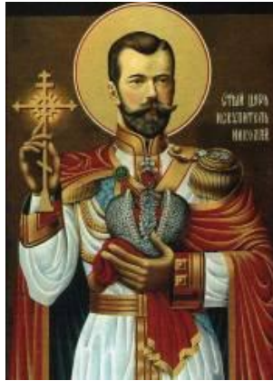
НИКОЛАЈ ДРУГИ - ОКЛЕВЕТАНИ ЦАР