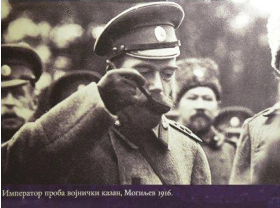
Император проба војнички казан, Могилев 1916.

Александар Елисејев (1972. историчар и публициста), у свом чланку “Николај II, као политичар јаке воље у смутним временима“, примећује да је чак и Ванредна комисија Привремене владе била принуђена да призна да Распућин није имао никакав утицај на јавни живот земље и то упркос чињеници да је била састављена од искусних правника-либерала, који су имали крајње негативан однос према царској династији и самој монархији.