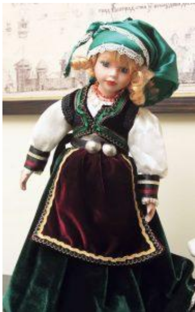
Луткица у цинцарској ношњи